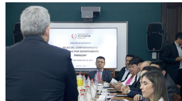
3. El Ministro del Interior en la reunión de presentación del proyecto de Gobernanza local.