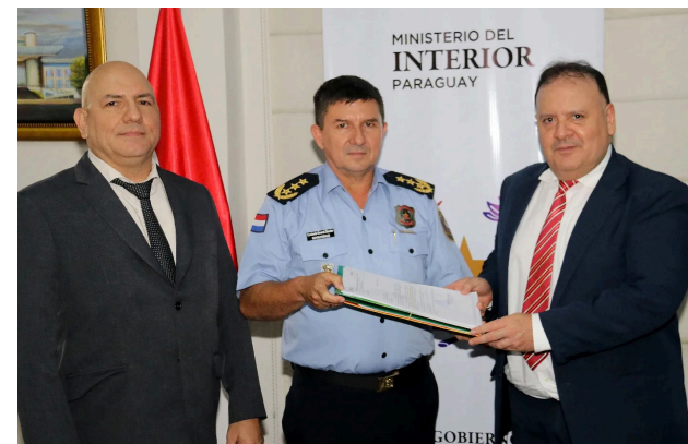
3. Miércoles 16 de noviembre 2023

El Viceministro de Asuntos Políticos del Ministerio del Interior, escribano Oscar Campuzano, entregó al Subcomandante de la Policía Nacional, Crio Gral. Dtor. Ramón Javier Morales Ojeda, los pedidos de reclamos y necesidades solicitados por los gobernadores e intendentes durante las jornadas de gobernanza local realizadas por el viceministerio de Asuntos Políticos del Ministerio del Interior, en el marco del Programa de "Fortalecimiento de la Gobernanza Local".