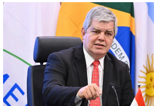
1. 09/11/2023 - "El tratado de Brasilia" que concede personería jurídica internacional a la comunidad de policías de las Américas (Ameripol) que servirá como mecanismo de cooperación entre las fuerzas de seguridad de los firmantes en total 12 países del continente.