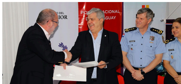
5. Firma del convenio en el Hospital de Policía "Rigoberto Caballero" 26 de diciembre del 2023