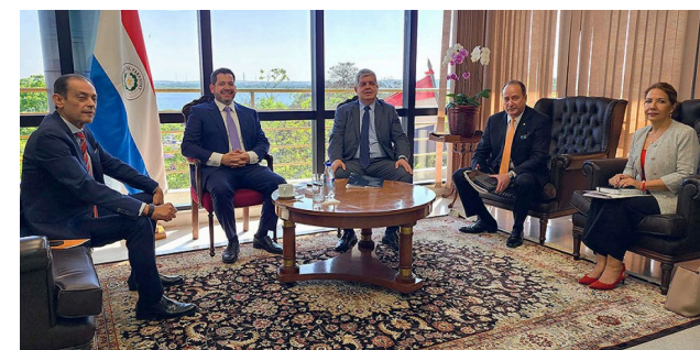
3. Reunión con el Presidente de la Cámara de Diputados para modificar la normativa de implementación de dispositivos electrónicos de control (tobilleras electrónicas).