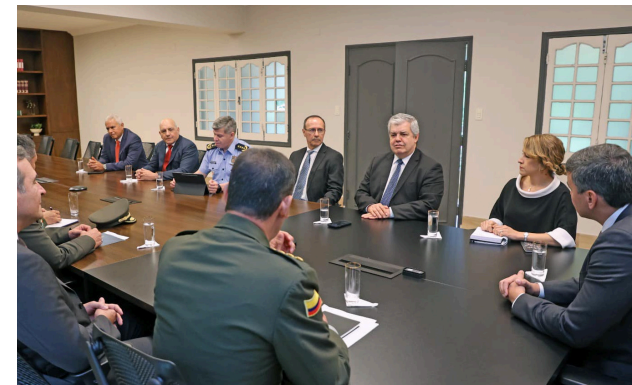
7. Reunión en Mburuvicha roga con el Presidente de la República Santiago Peña y el Gral. William Salamanca, Director General de la Policía Nacional de Colombia y su comitiva con autoridades Paraguayas 13 de noviembre 2023

Reunión con el Presidente de la República Santiago Peña y el Gral. William Salamanca, Director General de la Policía Nacional de Colombia, para renovar la cooperación oficial, también los desafíos para hacer frente al crimen organizado, narcotráfico, trata de personas, delitos ambientales, entre otros, y sentamos las bases del fortalecimiento de la cooperación en inteligencia, capacitación y formación académica.