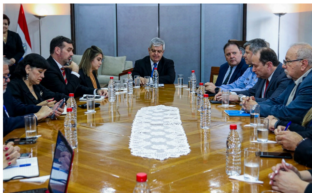
1. Segunda reunión Interinstitucional para impulsar el plan "Chau Chespi".

resultado en el marco al tráfico urbano, logrando un impacto favorable debilitando la oferta y desalentando la demanda del consumo, tráfico y comercialización de sustancias estupefacientes.