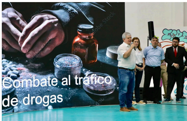
2. Presentación del "Plan de Acción de Lucha Contra el Abuso de Drogas, "SUMAR", conocido como "Chau Chespi"