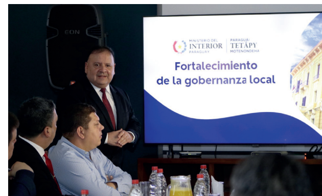
2. El Viceministro de Asuntos Políticos haciendo la presentación oficial del Proyecto

Dar seguimiento a los pedidos buscando su respuesta por parte de las Instituciones y llegar a visitar al 100% de los Departamentos.