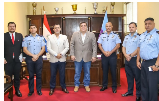
1. Reunión con el Gobernador del Guairá - Ampliación de cobertura del sistema de monitoreo en la Ciudad de Villarrica de 20 cámaras a 100 cámaras de CVV

Llevar a cabo los acuerdos institucionales proyectados y realizar una planificación detallada que incluya el relevamiento de las cámaras de seguridad. El propósito de esta planificación es incorporar más cámaras, realizando una distribución estratégica de las mismas, para maximizar la cobertura y abordar áreas críticas en términos de seguridad y emergencias.