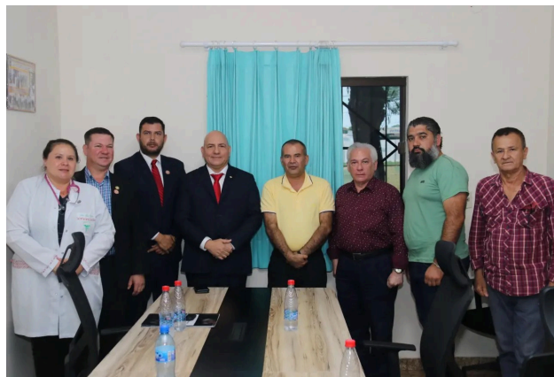
2. Miércoles 8 de noviembre 2023

El viceministro de Seguridad Interna, Crio. Gral. Insp. (R) Óscar Rafael Pereira, visitó el Dpto. de Alto Paraná para dar una respuesta a la ciudadanía en materia de seguridad luego de la visita del Ministro del Interior en la jornada de fortalecimiento de la gobernanza local.