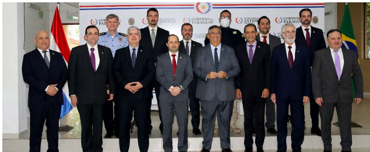
2.. 27/10/2023 - El ministro de Justicia y Seguridad Pública (MJSP) de Brasil, Flavio Dino de Castro e Costa, firmó un acuerdo bilateral en materia de seguridad con el Gobierno del Paraguay, a través de las instituciones responsables de los organismos de seguridad de ambos países.