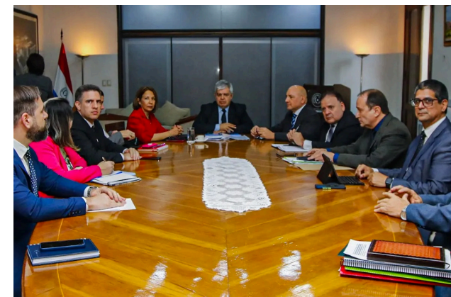
2. Reunión para analizar la implementación de un plan piloto para el uso de las primeras 100 tobilleras electrónicas