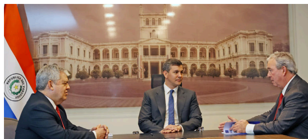
2. Reunión en Mburuvicha Roga entre el Presidente de la República Santiago Peña y los Ministros Luis Alberto Heber y Enrique Riera.

Con el propósito de revisar la agenda bilateral en los desafíos en seguridad de la región, así como también sobre modelos y estrategias para el combate al crimen y los delitos.