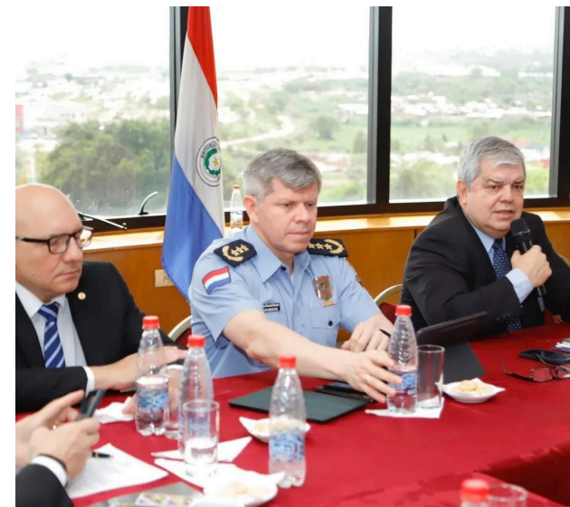
1. El Viceministro de Seguridad Interna, el Comandante de la Policía y el Ministro del Interior