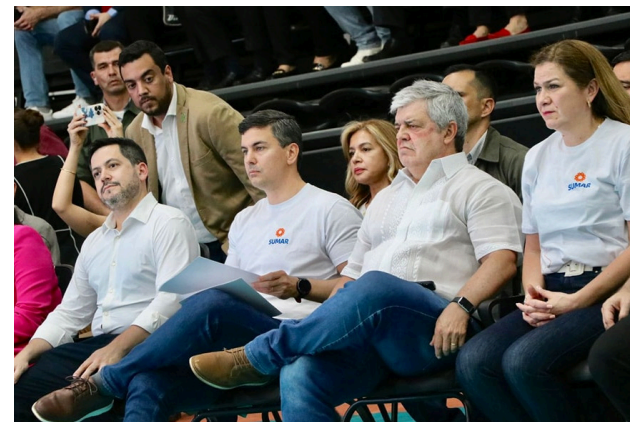
3. Presencia del Presidente de la República, Santiago Peña, Ministro del Interior y otros ministros del Poder Ejecutivo, autoridades legislativas e invitados especiales, el evento se realizó en la Secretaria Nacional de Deportes.