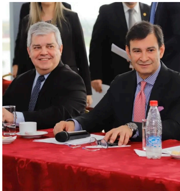
1. El Ministro del Interior y el Presidente del Senado

Orientar al mando institucional en la identificación, anticipación, mitigación y prevención de hechos que puedan incidir negativamente en la integridad, transparencia institucional, organizacional; coadyuvando a la obtención de información frente a fenómenos delictivos y de corrupción que puedan afectar la convivencia y seguridad ciudadana.