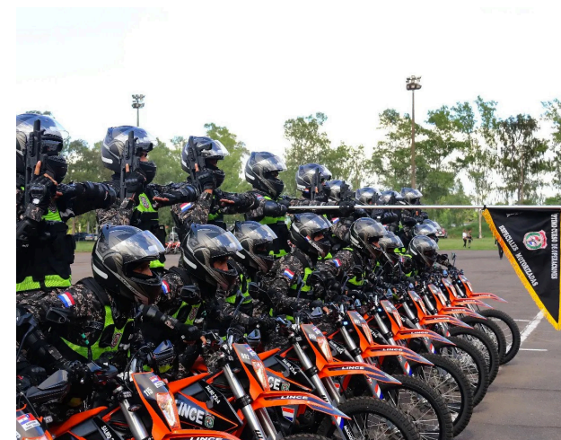
2. Presentación de Grupo Lince en la Ceremonia de Egreso 2023