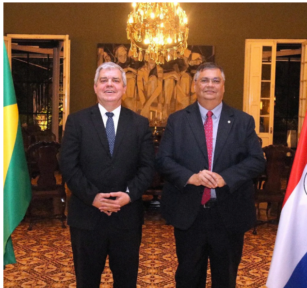
5. El ministro del Interior y Seguridad Pública (MJSP) de Brasil, Flavio Dino de Castro e Costa. 27 de octubre 2023

Con ocasión de la visita del Ministro, se realizó la Cumbre sobre Seguridad y Lucha contra la Delincuencia Transnacional liderada por el Excelentísimo señor Presidente de la República, donde se suscribió el Compromiso Asunción.