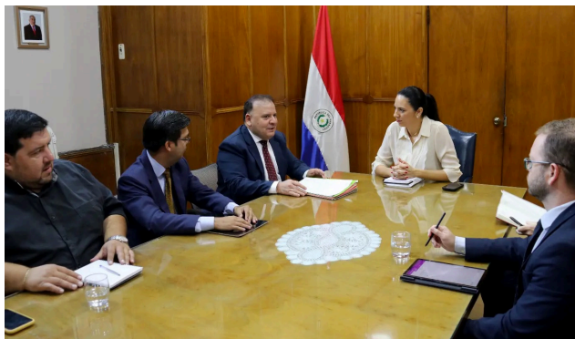
1. Miércoles 15 de noviembre 2023

El Viceministro de Asuntos Políticos del Ministerio del Interior, escribano Óscar Campuzano, presentó a la Ingeniera Claudia Centurión, ministra de Obras Públicas y Comunicaciones, los pedidos de reclamos y necesidades solicitados por los gobernadores e intendentes durante las jornadas de gobernanza local realizadas por el viceministerio de Asuntos Políticos del Ministerio del Interior, en el marco del Programa de Fortalecimiento de la Gobernanza Local, dentro de la acción interinstitucional de los primeros 100 días del Gobierno del Paraguay.