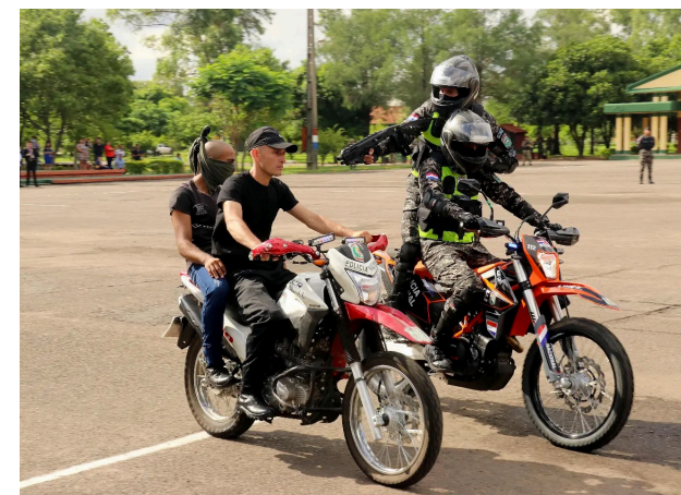
3. Presentación de Grupo Lince en la Ceremonia de Egreso 2023