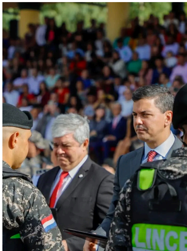
1. El Presidente de la República y el Ministro del Interior en el egreso de los 600 Linces

de equipamientos como chalecos tácticos, cámaras corporales (BodyCam), que serán utilizados por la Unidad de Operaciones Tácticas Motorizadas (LINCE).