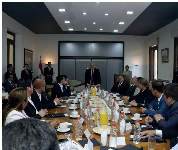
1. El Ministro del Interior realizando un discurso previo a la presentación.

de los pedidos, principalmente en lo que respecta a la infraestructura de patrulleras y la dotación de personal. En segundo lugar, se encuentran los pedidos relacionados con la infraestructura vial, con un 16% de los pedidos. Seguido de cerca, se encuentran los pedidos relacionados con la salud (11%), la energía eléctrica (8%) y la asistencia productiva (6%). Uno de los principales logros de estas jornadas ha sido la participación de más de (20) veinte instituciones públicas, quienes se han desplazado hasta el interior del país para escuchar las demandas y buscar soluciones dentro de sus posibilidades.