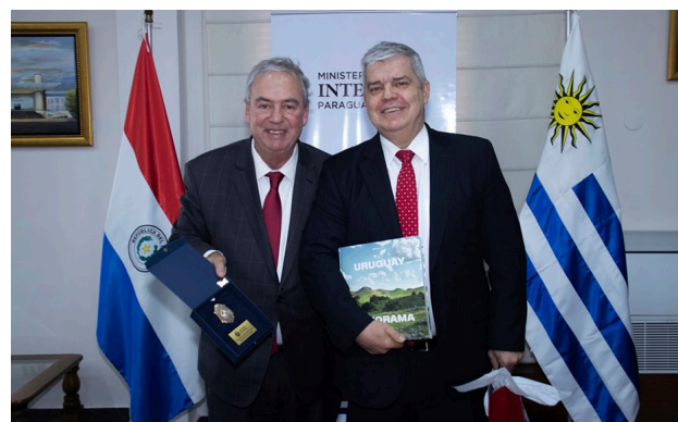
3. El Ministro del Interior Enrique Riera Escudero mantuvo una reunión con su par del Uruguay Luis Alberto Heber 03 de Octubre 2023