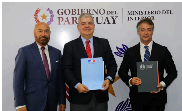
1. 26/09/2023 - Rubricaron sus firmas el ministro Riera, el Embajador Pierre Soccoja y Bertrand Barbe representante de CIVIPOL de Francia.

A través del cual se promoverá la cooperación técnica institucional dirigida a fortalecer la capacidad de las fuerzas de seguridad en Paraguay y apoyar políticas públicas que promuevan el diálogo social, el mantenimiento de la seguridad interna y la gobernabilidad democrática con respeto a los derechos fundamentales.