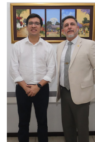
Reunión para la Ampliación de cobertura del sistema de monitoreo en Ciudad de Este, Pte. Franco, Hernandarias y Minga Guazú