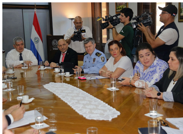
1. Primeras acciones para la implementación de un Plan Piloto para el uso de tobilleras electrónicas

Presentación de borrador de proyecto de Ley que modifica y amplía varios artículos de la ley 5863/17 "Que establece la Implementación del Dispositivos Electrónicos de Control" y deroga la ley 6345/19, el cual cuenta con sanción por parte de la Cámara de Diputados (Expediente: D-2374908). Con las modificaciones propuestas se pretende garantizar la aplicabilidad de los dispositivos.