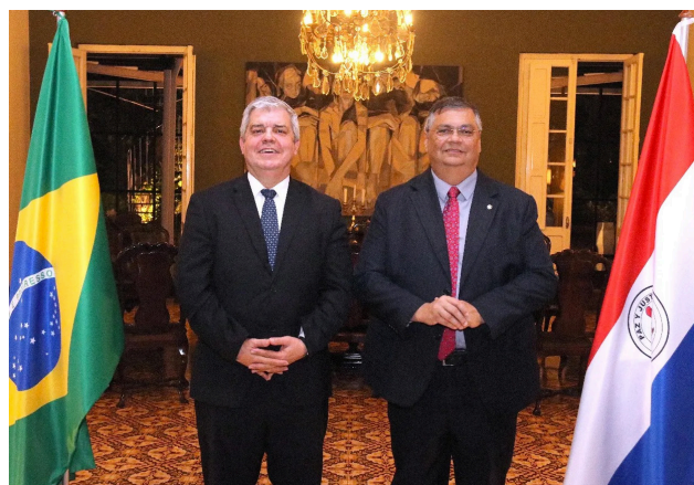
3.. 27/10/2023 - El Ministro del Interior y el Ministro de Justicia y Seguridad Pública (MJSP) de Brasil, Flavio Dino de Castro e Costa.