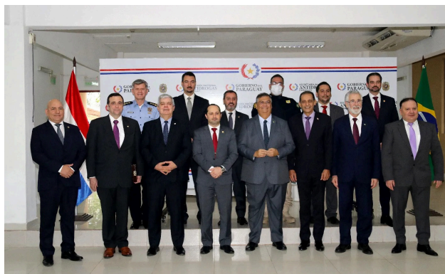
6. El ministro del Interior y autoridades luego de la firma del acuerdo bilateral en materia de seguridad con el Gobierno del Paraguay. 27 de Octubre 2023