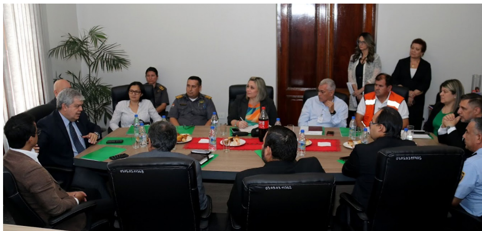
Reactivación de la Mesa Interinstitucional entre los integrantes del Sistema Nacional de Emergencias - Ministerio del Interior, Policía Nacional, Ministerio de Salud, IPS, Bomberos Voluntarios, Secretaria de Emergencia Nacional, Ministerio Publico, Mujer, Niñez, Policia Caminera y Municipalidad de Asunción.