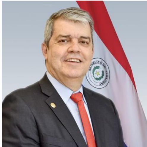
1- Ministro del Ministerio del Interior