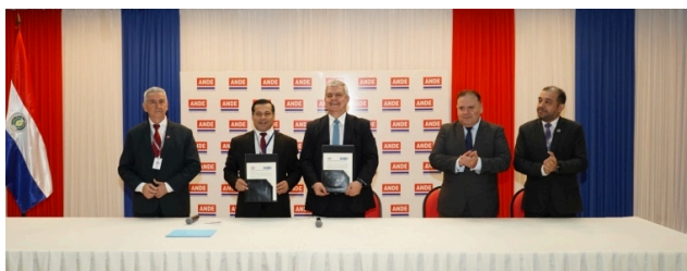
1. El ministro del Interior, el Presidente de la ANDE también participaron del acto, el viceministro de Asuntos Políticos del Ministerio del Interior, Óscar Campuzano, el viceministro de Seguridad Interna, Crio. Gral. Insp. (R) Óscar Pereira, el comandante de la Policía Nacional, comisario General Director, Carlos Benítez, directores y funcionarios de la ANDE e invitados especiales. 24 de agosto 2023

El mencionado convenio establece un trabajo conjunto con el Ministerio del Interior, la Policía Nacional, las Municipalidades y la sociedad civil, con obras que mejoren el sistema de iluminación pública en sitios estratégicos y en zonas críticas